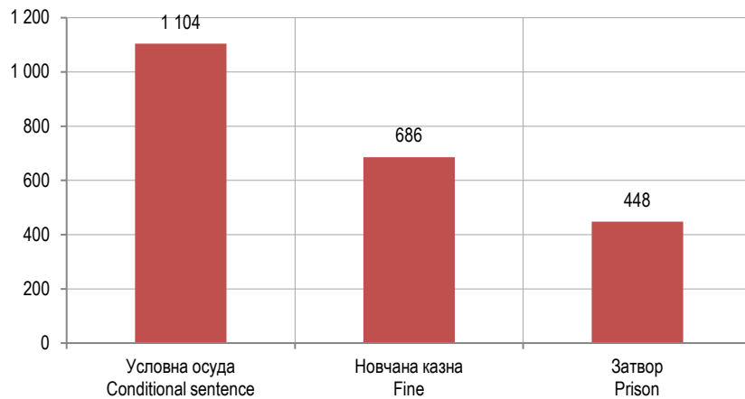
Графикон 2. Осуђена пунољетна лица – најчешће изречене кривичне санкције, 2025. Graph 2. Convicted adults - imposed criminal sanctions, 2025